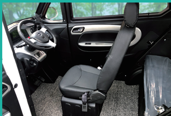
前方クルースペース