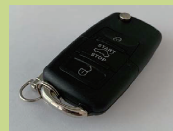
キーレスエントリー