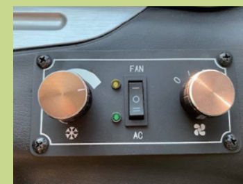
小型スポットクーラー