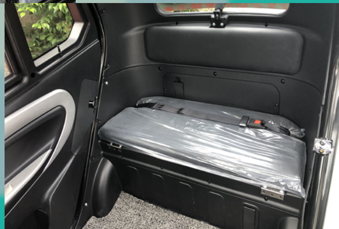
後方ラゲッジスペース