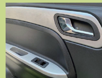
両側電動パワーウィンドウ